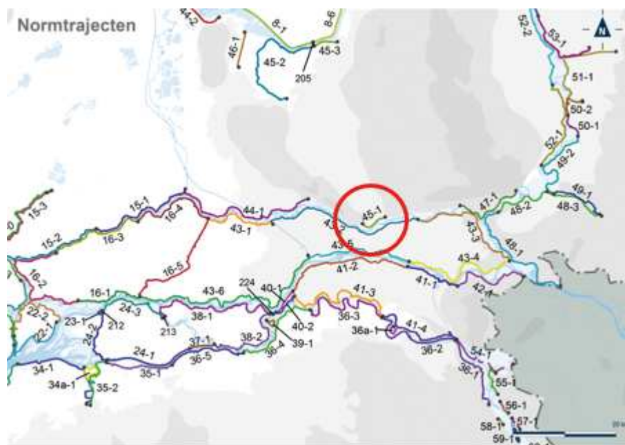
Figuur 1: locatie van de Grebbedijk (dijktraject 45-1) in rood omcirkeld

Het waterschap Vallei en Veluwe beheert ruim 130 kilometer primaire waterkeringen langs de IJssel, de Eem en Randmeren en de Nederrijn. De Waterwet bepaalt dat de waterkeringbeheerders elke 12 jaar de veiligheid voor alle primaire waterkeringen een veiligheidsbeoordeling uitvoeren. Deze veiligheidsbeoordeling betreft het dijktraject 45-1 (Grebbedijk) langs de Nederrijn.