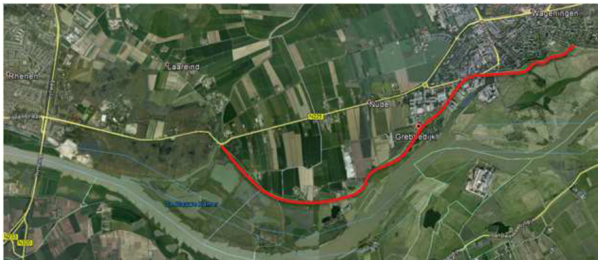
Figuur 2: de ligging van de Grebbedijk (in rood weergegeven)

In de Waterwet is de overstromingskansnorm voor de Grebbedijk vastgelegd op 1/100.000 per jaar (signaleringswaarde) en 1/30.000 per jaar (ondergrens).