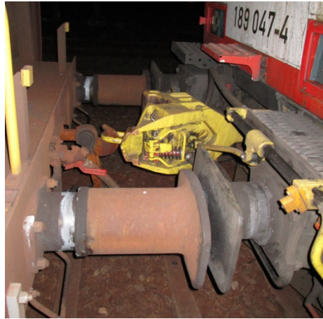
Figuur 5. Gekoppelde hulpkoppeling BR 189-AK