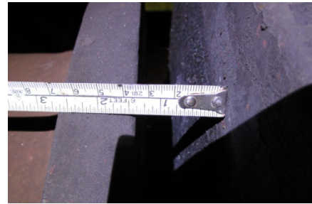
Figuur 6. Veerspel van 3 á 4 cm.

Deze speling zorgt voor schokken in de trein tijdens het rijden op moment van wisselende tractie en/of remmen van de treinen waardoor langskrachten ontstaan die de trein gevoeliger maakt voor ontsporing. Speling op de koppelingen van treinen verhoogt daarnaast de kans dat de koppeling breekt en daarmee dat de trein splitst.