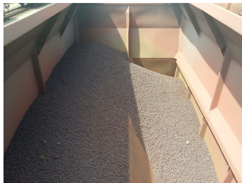
Figuur 2. Beladen Falns- wagen uit trein 48719

Voor het goede begrip van deze paragraaf is het van belang om te realiseren dat ijzererts dat via het spoor vervoerd wordt is verwerkt in korrels, zogenaamde pallets. Deze pallets hebben een hoog soortelijk gewicht. Vanwege het maximale laadvermogen van de wagens voor deze ijzerertskorrels, wordt een wagen als volledig beladen beschouwd als hij voor ongeveer een derde van het volume beladen is. (Zie figuur 2)