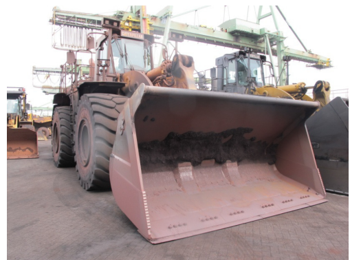
Figuur 3. Caterpillar ML57 (type 990).

EMO heeft voor het beladen van wagens de beschikking over een automatisch beladingsstelsel. Het proces verloopt in een normale situatie zo dat een locomotief van EMO aan de te beladen wagens wordt gekoppeld. Deze locomotief trekt de wagens met een vastgestelde lage snelheid door het automatische laadstelsel, dat er voor zorgt dat de wagens op de juiste wijze en met de juiste hoeveelheid ijzerertskorrels van bovenaf beladen worden. Door EMO is een zogenaamd profiel van belading opgesteld, dat rekening houdt met het type goederenwagon, het gewicht van de lading en de totaal met de trein te vervoeren hoeveelheid lading. Dat vastgestelde profiel is een profiel dat per wagentype en soort belading is opgesteld.