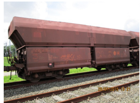
Figuur 1. Wagen van het type Falns

De 35 wagens zijn alle vier- assige goederenwagens van het type Falns. (zie figuur 1.) De wagens zijn aan de bovenkant open, zodat de lading er van boven in gestort kan worden. De wagens van dit type worden over het algemeen gebruikt voor kolenvervoer, maar worden op 16 juni dus gebruikt voor het vervoer van ijzerertskorrels.