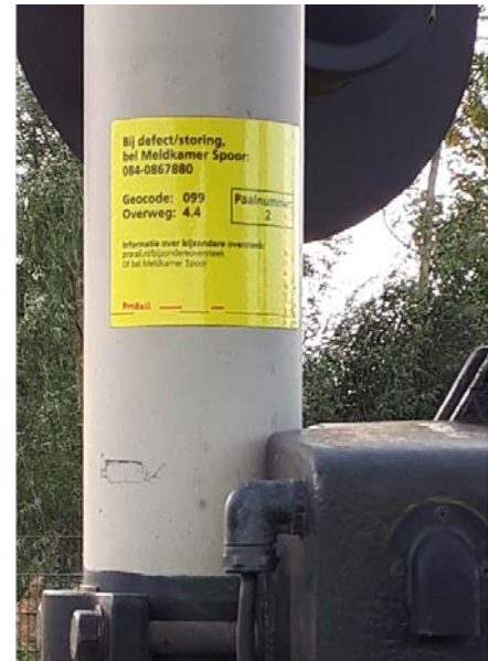
Figuur 2. Voorbeeld van toepassing van de informatiesticker om overweggebruikers te informeren over een bijzondere oversteek

De inspectie verwacht ook van ProRail dat zij actiever gaat monitoren op bijzondere oversteeken. De behandelde aanvragen voor een Bijzondere oversteek geven nog niet het beeld dat alle, vooral bijzondere wegtransporten, de procedure kennen. In het verleden deden zich meerdere ernstige incidenten voor met dit soort bijzondere wegtransporten. De inspectie verwacht dat deze transporten meerdere keren per jaar plaatsvinden. Waarbij overweggebruikers de door ProRail voorgestelde procedure zouden moeten volgen. Dit vraagt van ProRail dat zij meer voorlichting moet gaan geven aan mogelijke gebruikers van overwegen waarvoor de procedure bijzondere oversteek van toepassing kan zijn.