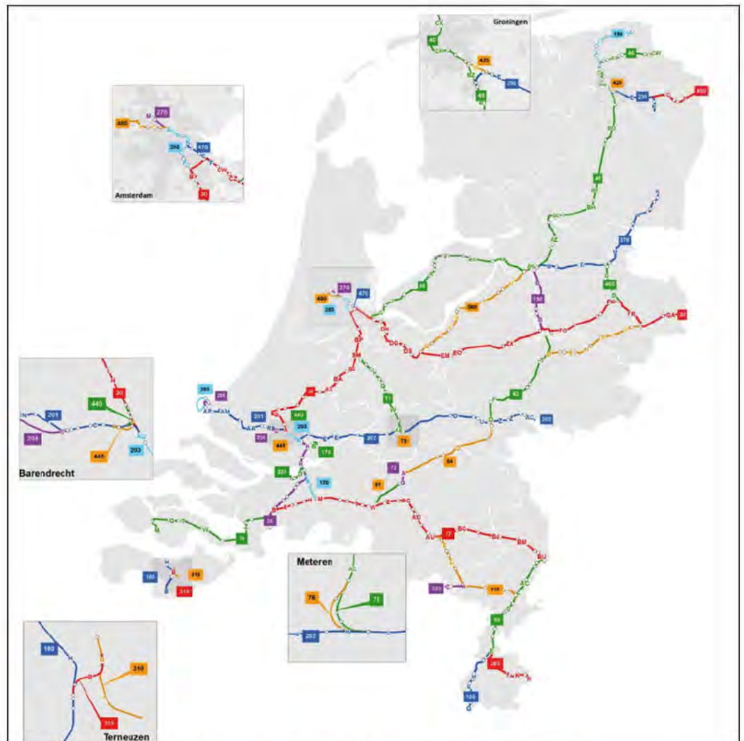
Figuur 2. Basisnet Noord en Basisnet Zuid, komen uit de wettelijke Regeling Basisnet http://wetten.overheid.nl/BWBR0035000/2016-12-01#BijlageI