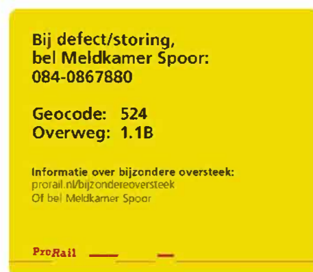
Figuur 4. Voorbeeld van sticker om overweggebruikers te informeren over een bijzondere oversteek

De inspectie verwacht ook van ProRail dat zij actiever gaat monitoren op bijzondere oversteken. De behandelde aanvragen voor een Bijzondere oversteek geven nog niet het beeld dat alle, vooral bijzondere wegtransporten, de procedure kennen. In het verleden deden zich meerdere ernstige incidenten voor met bijzondere wegtransporten. De inspectie verwacht dat deze transporten meerdere keren per jaar plaatsvinden. Daarbij zouden de overweggebruikers de procedure zeker moeten volgen. De inspectie denkt dat overweggebruikers dat niet altijd doen vanwege de minimale aanvraagperiode van 48 uur.