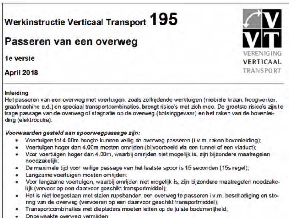
Figuur 3. Fragment van de VVT instructie over het passeren van overwegen.