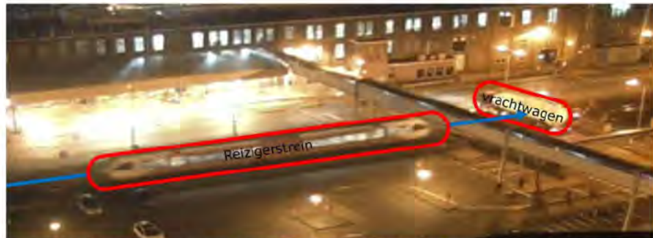
Figuur 5. Still van een beveiligingscamera van de aanrijding op 11 januari 2019 van reizigerstrein 37361 van Arriva (van Leeuwarden naar Groningen) die met een snelheid van circa 80 – 100 km per uur op een melkpoeder beladen stilstaande vrachtwagen botst. De overweg Merodestraat te Leeuwarden is een met automatische halve overwegbomen (AHOB) beveiligde overweg.

Een dergelijk waarschuwingssysteem voor een object op een overweg had mogelijk de aanrijding van 11 januari 2019 kunnen voorkomen of de gevolgen ervan kunnen beperken (Figuur 5) 20 .