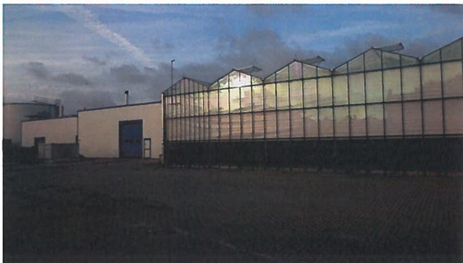
Kassen bij Sexbierum. Om lichtuitstraling 's nachts tegen te gaan worden de kassen aan de zijkant afgeschermd. Als totaal vallen de kassen vanaf de waddendijk gezien niet op.

Enkele gemeenten zijn actief bezig met het behoud van de landschappelijke kwaliteiten van Waddenzee, bijvoorbeeld voor wat betreft de duisternis. Zo is in Franekeradeel in een strook langs de Waddenzee de straatverlichting achterwege gelaten en worden kassen aan de zijkant afgeschermd. Verdere uitbreiding van de glastuinbouw is voorzien, waarbij afspraken zijn gemaakt over beperking van de lichtuitstraling. Texel wil reguliere verlichting vervangen door dimbare led-lampen.