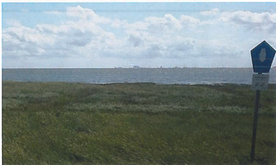
De Eemshaven, inclusief olie-opslagtanks en windturbines, is goed te zien vanaf de Waddenzee en ook vanaf het eiland Borkum, 15-20 km er vandaan.