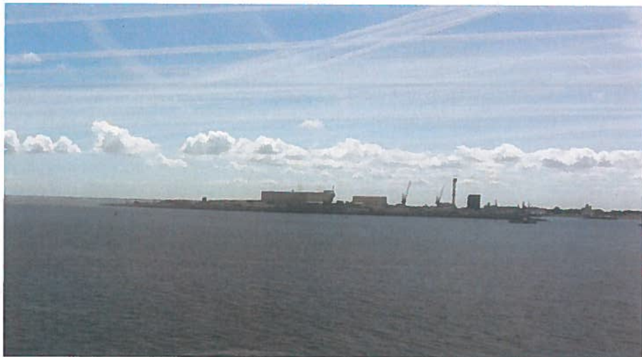
De haven van Den Helder vanaf de Waddenzee. Het Dok (45m hoog) is door de gemeente als referentiepunt genomen voor de stedenbouwkundige invulling elders in de stad.

In de havensteden is hoogbouw gepleegd, zowel in de havens zelf als in het aansluitend stedelijk gebied, waarbij aansluiting is gezocht bij aanwezige bouwhoogtes in de havens. Ook hebben uitbreidingen plaatsgevonden in de havens zelf, die zichtbaar zijn vanaf de Waddenzee. Voor zover de bebouwingshoogtes aansluiten bij de verticale bebouwingscontour is het conform de regels die het Barro stelt aan bestemmingsplannen (artikel 2.5.12 bebouwing in het waddengebied). Het Barro schrijft alleen voor dat bij de voorbereiding van het bestemmingsplan een passende beoordeling heeft plaatsgevonden. In het kader van het onderzoek is niet meegenomen of dat heeft plaatsgevonden.