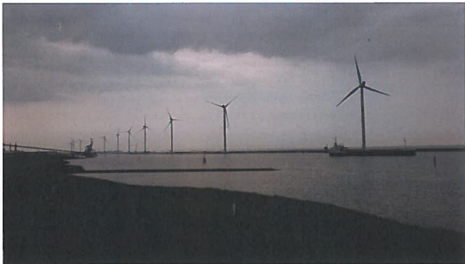
Windturbines langs de Eems-Dollard ten zuiden van Delfzijl.

Het is opvallend dat in het Eems-Dollardgebied een aantal windturbineparken aanwezig is, die tot ver op de Waddenzee zichtbaar zijn. Artikel 2.5.12 zegt hierover dat in bestemmingsplannen in buitenstedelijk gebied regels dienen te worden opgenomen die ertoe strekken dat de maximaal toelaatbare bouwhoogten alsmede de aard of de functie van nieuwe bebouwing passen bij de aard van het omringende landschap. Indien het gaat om bestemmingsplannen die de havengerelateerde en stedelijke bebouwing in Den Helder, Harlingen de Eemshaven en Delfzijl mogelijk maken, kan hiervan worden afgeweken.