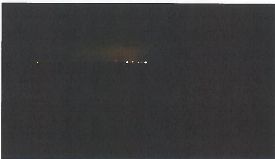
De industriehaven van Harlingen bij nacht, gezien vanaf de dijk bij Sexbierum. Twee felle lampen vallen meer op dan het schijnsel van de stad als geheel.

Voor zover in het waddengebied sprake is van effecten op de kwaliteit van de duisternis van de Waddenzee heeft dit vooral betrekking op de havens. Indien hier in het bestemmingsplan een afweging is gemaakt als in 2.5.5 ('nee-tenzij') is dit overeenkomstig het Barro.